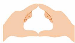
①両手の親指と人差し指で輪を作る