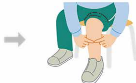
②利き足ではない方のふくらはぎの一番太い部分に当てる